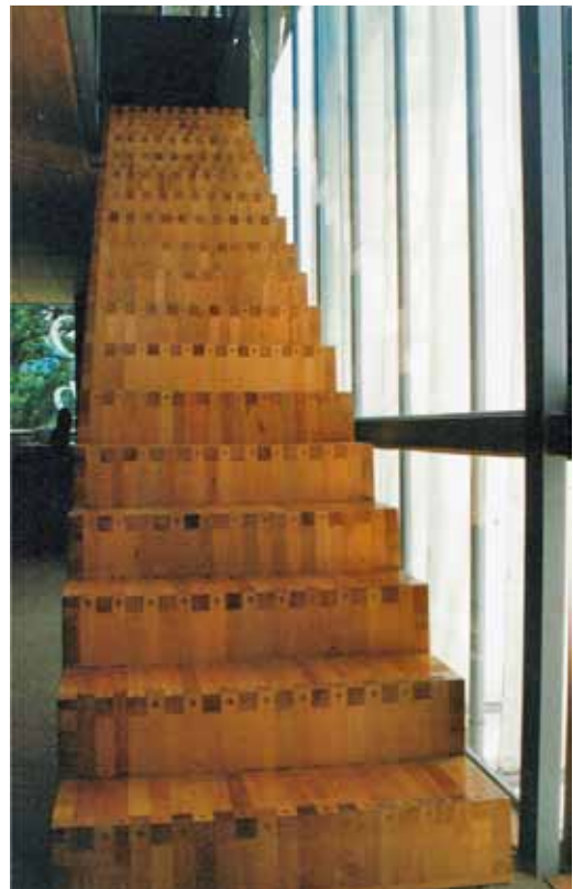
Open Office Bash