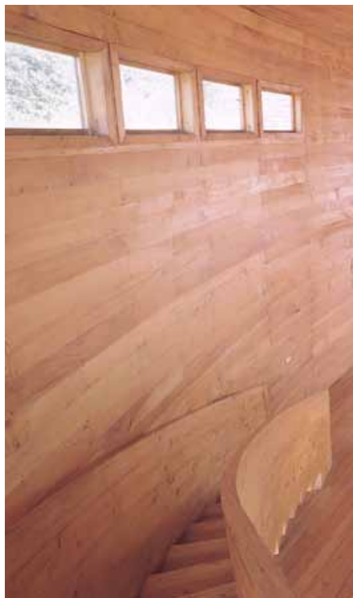
Casa del fuego

Omnim sunt et inctet eius pligentur aute aut omnitaqui cones sed quid ut quatati accus ea conseni maionec errovideste digent, quae vid