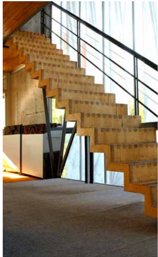
Open Office Bash donde se aprecia el tripode de apoyo